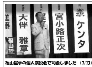
福山選挙の個人演説会で司会しました (7/13)

ほとんど毎日、何らかの形で情報を発信しています。具体的には、日記帳は写真を必ず入れて2・3日に1回、掲示板は毎日私を含めて、誰かが投稿していただいています。この投稿の中から、本会議で一般質問をしたり、委員会質疑をしたりして結果を出しています。その報告や、やり取りもリアルタイムでお届けしています。右の写真も日記のページなどに掲載中です。是非一度お立ち寄り下さい。