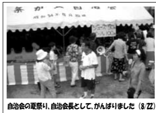
自治会の夏祭り、自治会長として、がんばりました (8/22)