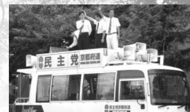
地元の八条が丘で街宣車の上から。左、ケンゴ府議、私