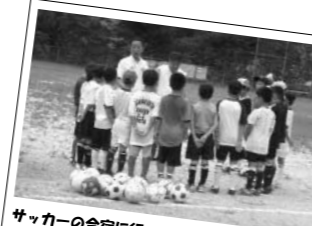
サッカーの合宿に行ってきました (8/29)