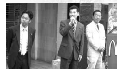
投票日のあくる朝1番に阪急長岡天神駅前でお礼の挨拶。ケンゴ府議、ケンタ衆議、私